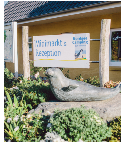
Startpunkt Nordseecamping Starting Point

Wadden Sea National Park. Close to Husum's Mühlenau, the route takes you overland through the Südermarsch towards Uelvesbüll. The sparsely populated landscape is exactly as you imagine the north to be – flat or as they say here „platt“. Last stage: Simonsberg. The North Sea and numerous storm surges have shaped Simonsberg.